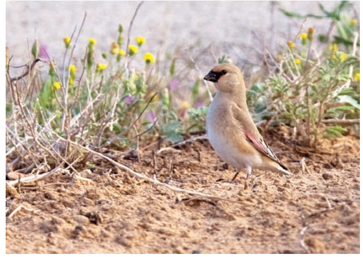
Inte fullt så ökenbunden som namnet antyder, ökenfinkarna vill gärna ha lite torra odlingar, ogräs i vägkanten och en viss nederbörd.

närproducerad måltid medan man njuter av gråfiskare och vitvingande tärnor från hängbron.