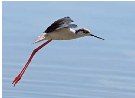
Stiltilöparen är vanlig i de syriskas våtmarkerna.

En typisk "Syrienhändelse" inträffade när fem rödhalsade gäss sköts i februari 2007,