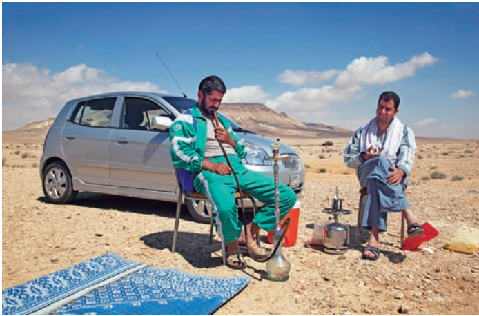
Paus längs vägen på syriskt vis: vattenpipa och té, scarf runt halsen och sandalen på sned. Får det vara ett bloss?