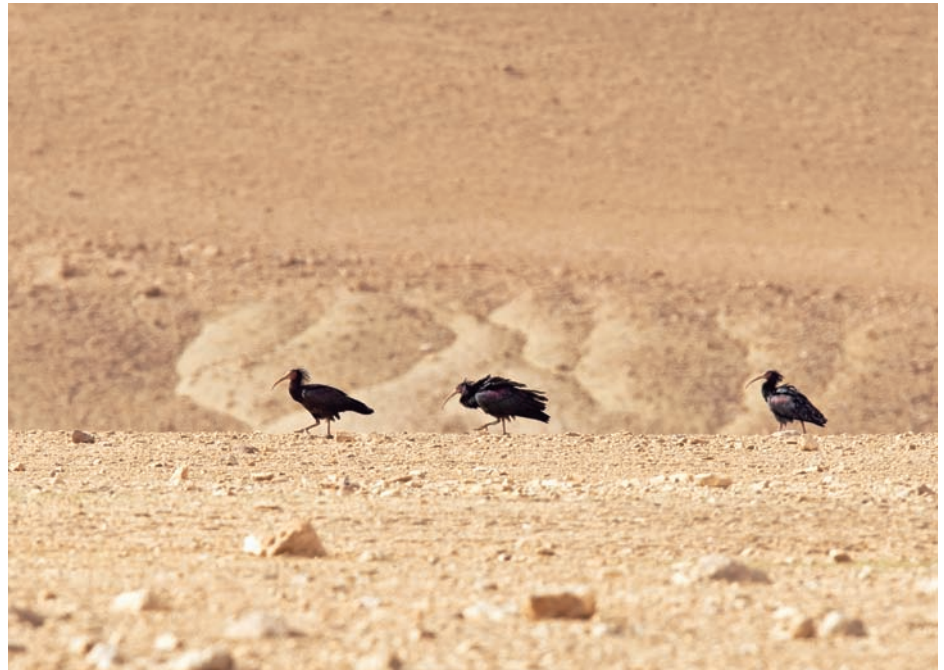
Sensationellt upptäckta år 2002 blev "Abu Mingal", eremitibisarnas arabiska namn, vid Palmyra säkerligen landets mest berömda fåglar.