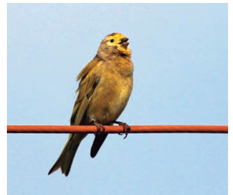
Syrien står med ett antal svåråtkomliga specialare som till exempel levantsiska. Bergsbyn Bloudan strax väster om Damaskus är en säker lokal.