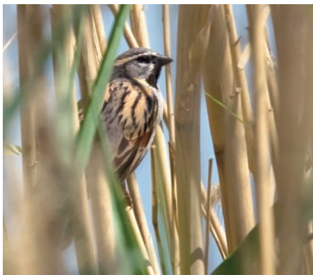
Vassarna vid Sabkhat al-Jabbul ger närkontakt med arter som mindre sumphöna, kaveldunsångare och, som här, tamarisksparr.

Många unga och välutbildade lämnar det kvävande samhällsklimatet för västvärldens större möjligheter till ett fritt liv och arbete.