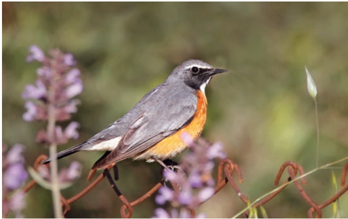
Vissa fåglar ger mer puls än andra, och mötet med en hane vitstrupig näktergal minns man länge. Häckfågel i bergssluttningar i nordväst och sträckgäst i halvökens isolerade trädgårdar.