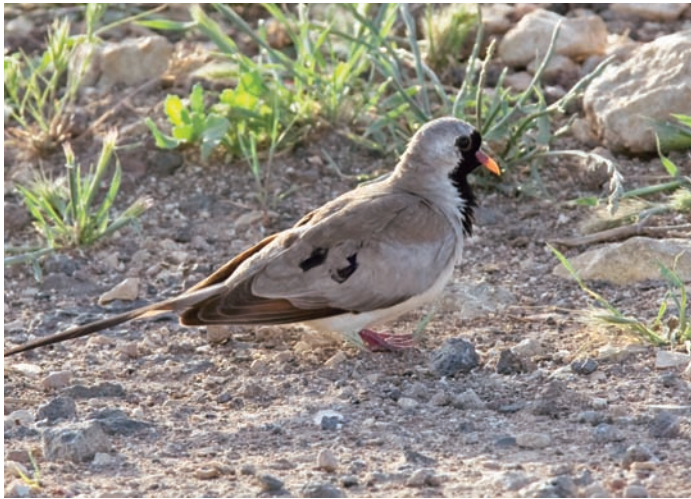
"Oj hörrö, stannal En långstjärtsduva!" Vid väggkanten i Deraa, sydligaste Syrien, i april 2009. Första obsen utanför Palmyra där en handfull ex finns.