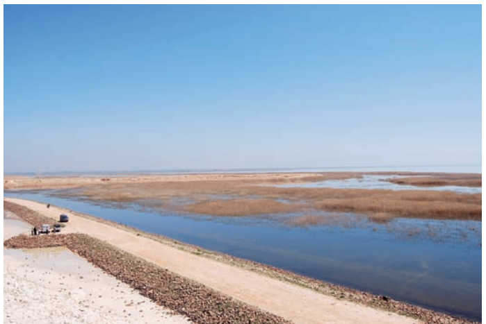
Sabkhat al-Jabbul är ett jätteområde strax söder om Aleppo i norra Syrien. Här övervintrar tiotusentals fåglar men det krävs tid, jeepar och vägvisare för att täcka in det hela. Men även ett dagsbesök är en häftig skådarupplevelse!