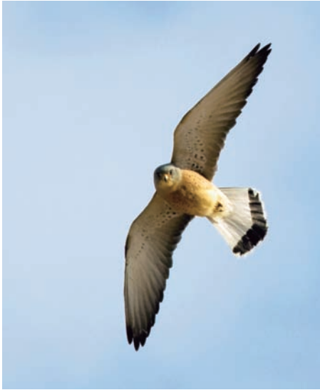
Längs vägen norr om Halabiyya i Eufratdalen finns en rödfalkskoloni vid klipporna, med spelande svart frankolin i bakgrunden.