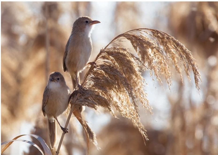
Sociala, livliga och ljudliga – mötet med irakskriktrastarna, som här vid hängbron över Euftrat i Deir ez-Zor, är häftigt!

Det är egentligen rätt otroligt att en sådan spektakulär och stor våtmark som Sabkhat al-