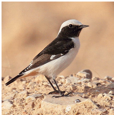
En karaktärsart runt ruinerna i Palmyra är sorgstenskivtåtan som under framför allt vinterhalvåret får sällskap av ett gäng kusiner som finsch- och cypernstenskivtåta.

Syrien är ett mestadels glesbefolkat land med cirka 20 miljoner invånare som ligger vid skärningspunkten mellan den tidigare så grekiskdominerade Medelhavskulturen och den