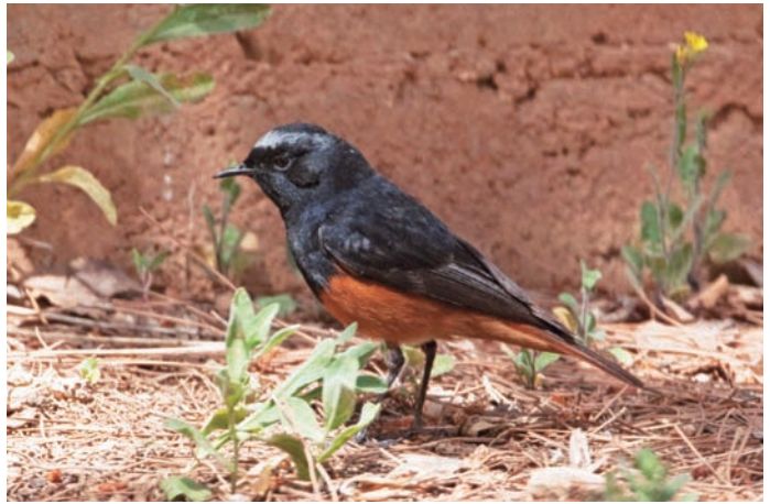
Sydostliga raser av en del arter ska man plugga in före resan, för att undvika hjärnsläpp i fält. Svart rödstjärt av rasen semirufus är en grann uppenbarelse.

När Hafiz al-Assad, president sedan 30 år tillbaka, dog år 2000 och hans son Bashar tog över ämbetet lättades atmosfären en aning men ingen reell skillnad har kunnat märkas.