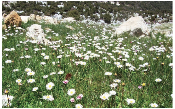
Den som trodde att Mellanöstern är lika med öken får tänka om. I bergsmassiven längs Medelhavskusten faller mycket snö under vintern. Biotop för vitstrupig näktergal och olivsångare.

arter. Den syriska Medelhavskusten är i princip utforskad av skådare och har några spännande lokaler i norr mot den turkiska gränsen. En av de nordligaste uddarna, Ras al-Bassit, besöktes i september 2007 och detta genererade två förstafynd för landet, gulnäbbad lira och toppskarv, vilket är exempel på hur underskådat landet är.