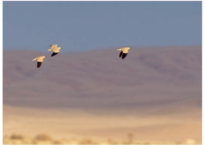
Runt Palmyra är den läckra ökenlöparen ganska vanlig och ses ofta i småflockar, distinkt svarttecknade i flykten.

Under sträckperioderna är odlingar och små oaser fulla av rastande småfåglar, inklusive regelbundet balkanflugsnappare, cyprenstenskviätta och olivsångare, och de få vattensamlingarna som finns drar till sig änder, vadare, hägrar och en del rovfåglar som går ner för att dricka.