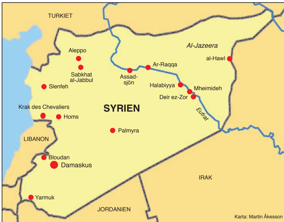
Karta: Martin Åkesson

der, Palmyra Society, har växt fram på 2000-talet och guidar nu besökande skådare i området.