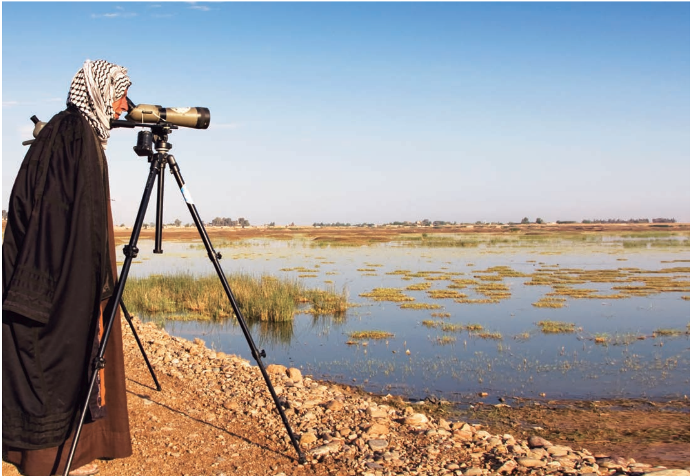
Fågelskådning och fågelskådare är något fullständigt främmande i Syrien – men också välkommet och uppskattat. Möten med den varma lokalbefolkningen lever kvar lika länge som minnena av alla kul arter man sett.