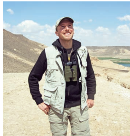
Artikelförfattaren pustar ut under sökandet efter visselhöna i Halabiyyas steniga branter med magnifik vy över Eufratdalen.