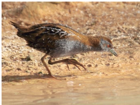
Dvårgsumphöna – man vet aldrig när den kan spankulera förbi. Ytterst svårsedd och sällan rapporterad, men de finns där. Syrien, april 2010.

Åk till Syrien och skåda fågel! Det är inte riskabelt, inte särskilt svårt, väldigt givande och