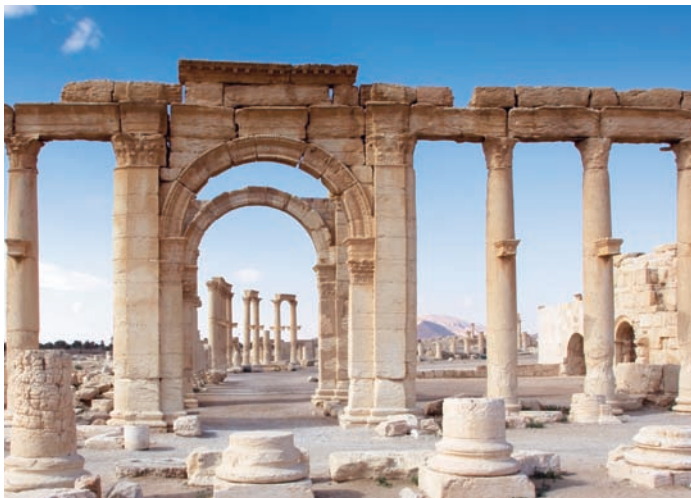
Under antiken var Palmyra, "palmernas stad" som romarna kallade den, en handelsmetropol mellan Medelhavet och Mesopotamien.

En sevärighet är den gamla hängbron, byggd av fransmännen på 1930-talet, och från denna kan man ta in den imponerande Eufrat som tyst glider söderut mot Irak, 15 mil bort. Samhällslivet här är annars präglat av jordbrukarkultur och de lokala produkter som säljs på marknader i staden. Det är med andra ord inga problem att få tag i en purfärsch och