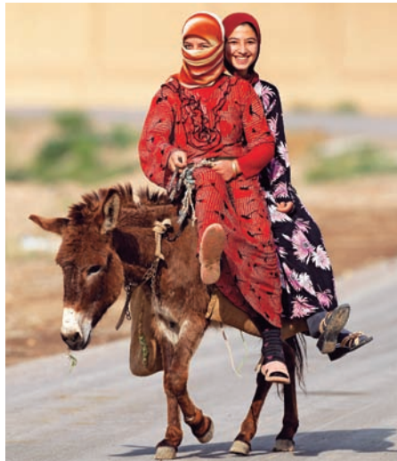
Fnittriga flickor på lokalt transportmedel i Eufratdalen. En i vårt gäng höll på att bli bortgift i denna by i april 2009

Ett annan läcker dagsetapp från huvudstaden är att ta sig upp i bergen vid den libanesiska gränsen. Här ligger byn Bloudan, en populär resort för arabiska turister som söker svalka under den heta sommaren, vilken är en