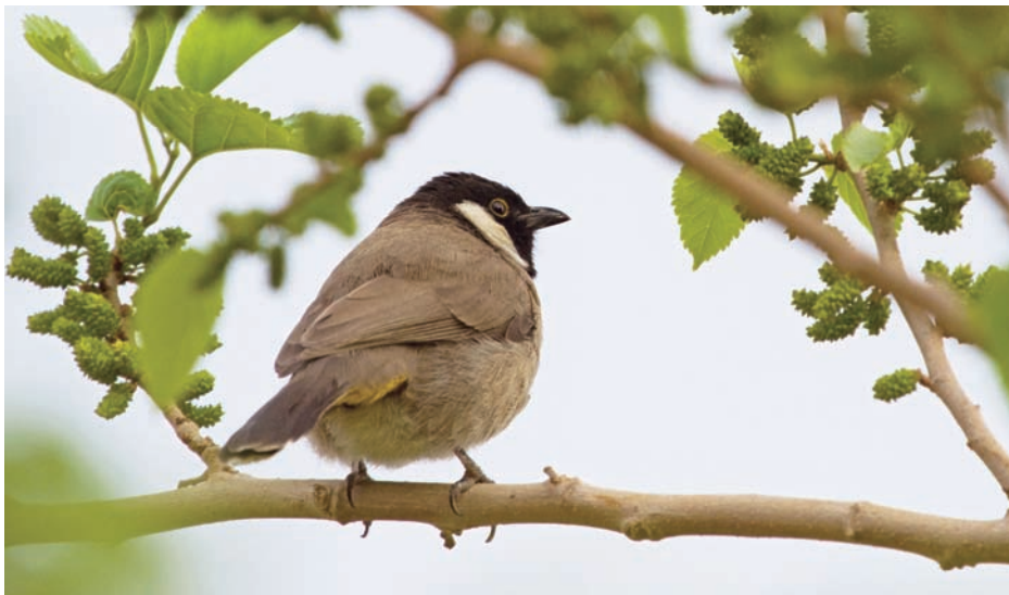
Från häckplatser i Irak och runt Persiska viken har den snygga vitkindade bulbylen expanderat mot nordväst och finns nu runt Deir ez-Zor vid Euftrat. Tidigare fanns arten även vid Palmyra, så kanske finns de vid fler outforskade oaser längst i sydost.