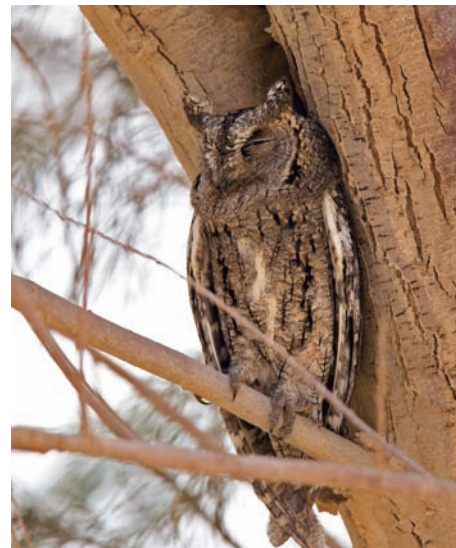
Utmattade flyttfåglar som dimper ner i isolerade dungar är ett bekant fenomen. Denna dvärguv satt vid entrén till Tallilareservatet utanför Palmyra.

na bakom borgen är en känd lokal för visselhöna men det kan krävas en del slit innan man hittar dem. Lyssna efter deras visslande läte, aningen likt småfläckig sump. I ett vassparti vid floden här hittades sensationellt en basrasångare i april 2006, första fyndet för landet. Artikel finns i Sandgrouse 2/2007.