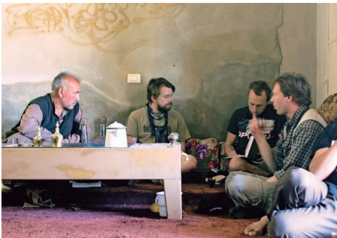
Svenska och syrisk (l) skådare över en kopp té i byns samlingshus i Jabbul. Ivern och engagemanget hos lokala intresserade är inte att ta fel på!

Svenska skådare känner igen tjingande talgoxar och svirrande grönfinkar men kan också glädjas åt balkan- och mellanspett, berghöna, vitstrupig näktergal, mästern, oliv- och svarthakad sångare, klippspurv och klippnötväcka. Byn Slenfeh, mycket vackert belägen nära bergsryggens topp med utsikt över Medelhavet, och borgen Qalaa't Salah ad-Din en bit norrut är två bra platser för nämnda