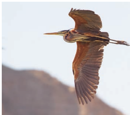
Under sträcket kan en del purpurhägrar ses även vid små dammar i den karga halvöknen, som här vid Wadi Abied.