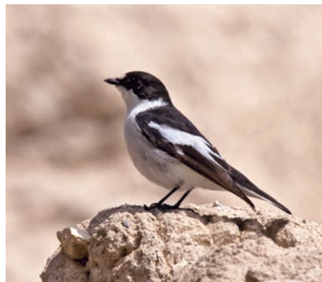
Under sträcket ses regelbundet spännande arter som denna balkanflugsnappare i halvökens oaser och odlingsar.

Idag är Palmyra, Tadmur på arabiska, en av landets mest berömda sevärdheter men de mängder av besökare som platsen gör skäl för har ännu inte nått hit. Detta är ett traditionellt beduinsamhälle som sett en mindre turistboom med en del hotell, restauranger och små butiker, men det är fortsatt rätt litet och stillsamt. Cirka 60 000 invånare är dock en mångdubbling från den tidigare lilla bosättningen. En grupp naturvårdare och fågelgui-