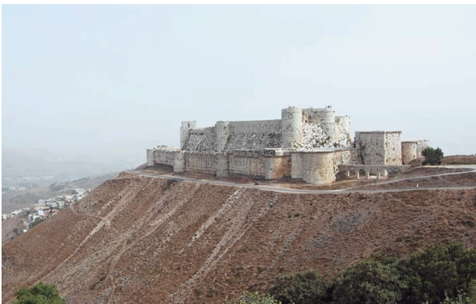
Krak des Chevaliers från 1100-talet är en världens bäst bevarade korsriddarborgar och ett måste för de flesta Syrienbesökare. För skådaren blir det sen inte sämre av att ett rikt rovfågelsträck passerar här under vår och höst!

De vidsträckt lämningsarna från den romerska handelsstaden dominerar Palmyra och samhällets centrum med hotell och restauranger ligger allt inom gångavstånd. Runt ruiner, glesa buskmarker och stenskravel kan arter som minervauggla, långstjärtsduva, sorgstenskvvätta, oriensångare, östlig sammetshätta, trädnäktergal och ökenfink noteras medan man begäpar antikens legender.