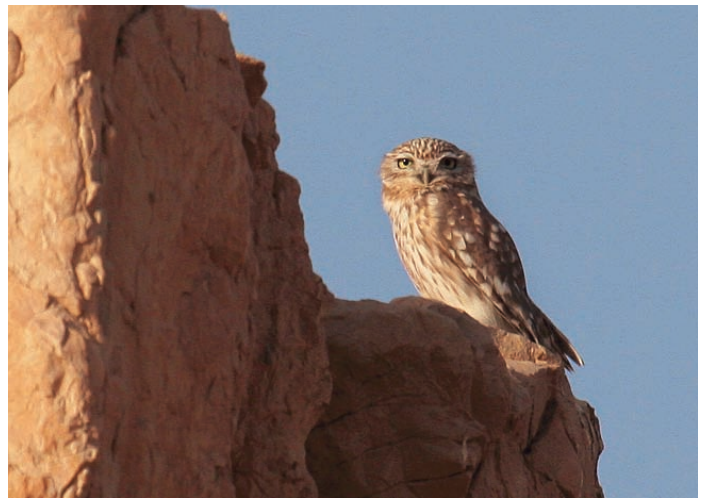
Minervauggla är rätt spridd och ses ibland vid ruiner och kolonnader som Palmyra och Aphamea, spanandes från avsatser och pelartoppar.