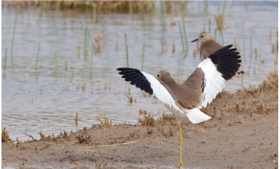
Vi är så långt österut så vi finner häckande sumpvipor! Flera lokaler i Eufratdalen hyser dessa sanslöst dekorativa djur.

Jabbul, 25 km söder om storstaden Aleppo, förblivit i praktiken okänd för västerländska skådare. Ytan av jätteområdet uppskattades 2003 till hela 260 km 2 och har påverkats av vatten som kanaliseras hit från Eufrat. Det har resulterat i en uppdelning av både salt, bräckt och färskvatten i ett ständigt evolverande vattensystem.