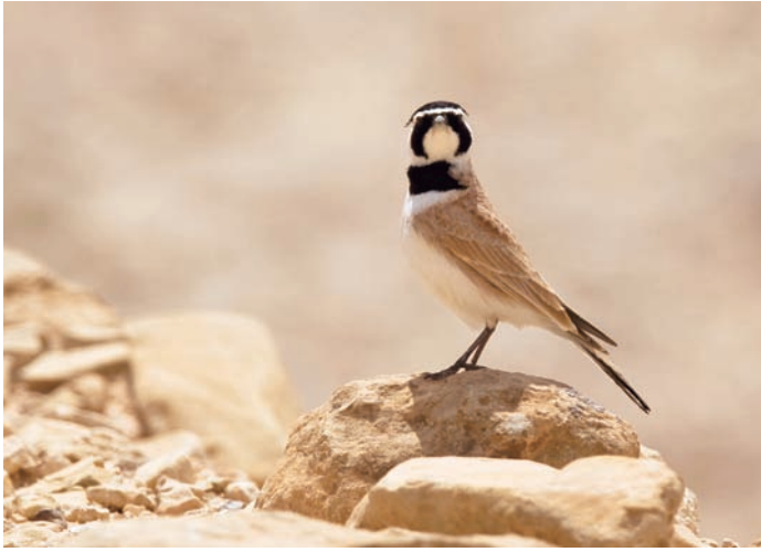
Något av en karaktärsart för de steniga och glest bevuxna halvöknarna i centrala Syrien, ökenberglärka.